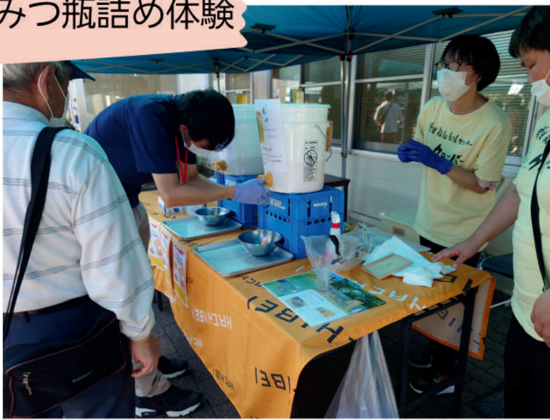
はちみつ瓶詰め体験