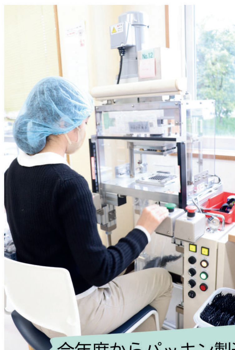
今年度からパッキン製造の 電動プレス機を導入しました

平均工賃20,000円を目標に、難易度の高い作業にも 果敢にチャレンジしています。また、少人数のグループワーク で働くために必要なことを学ぶ活動に取り組んでいます。 みんなでニョキニョキ成長中です！！