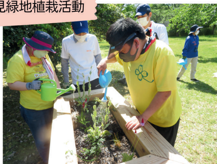
島見緑地植栽活動