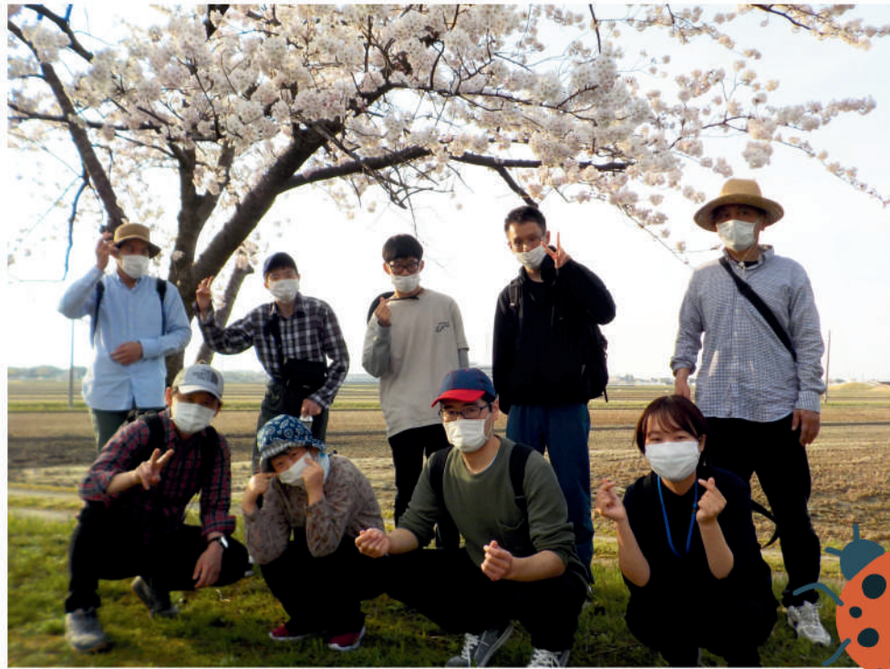
福島潟まで お花見ウォーキング!

「豊かな生活をおくろう」 一人ひとりの生活が充実するよう、 行事など楽しみを取り入れながら日々を過ごしています。