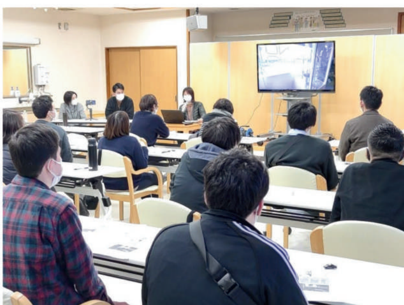
令和5年2月 コーヒー事業説明会