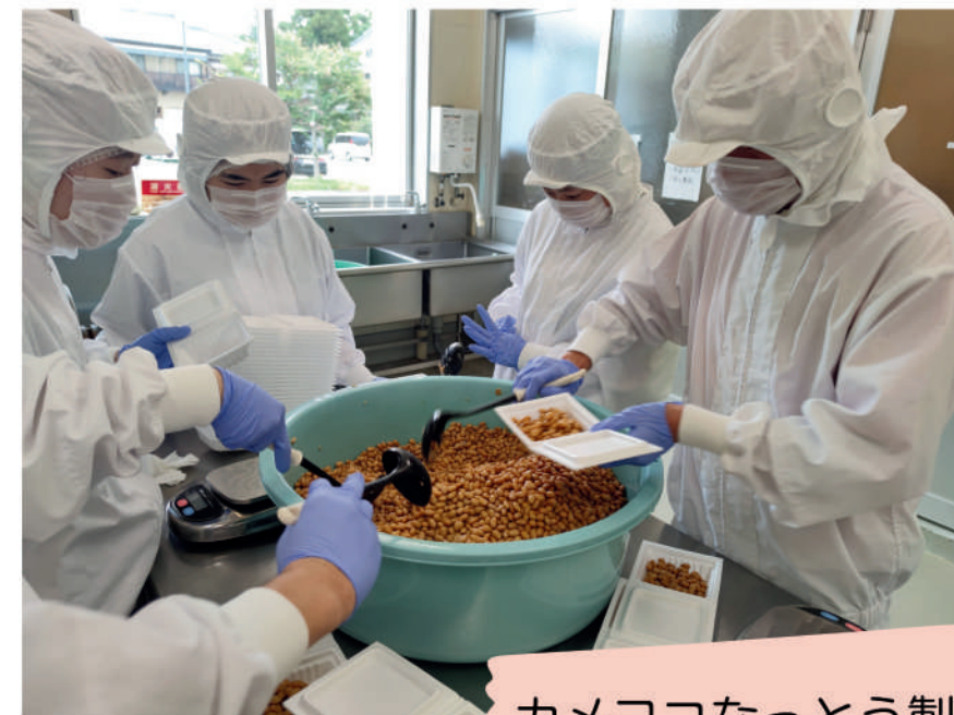
カメヨコなっとう製造