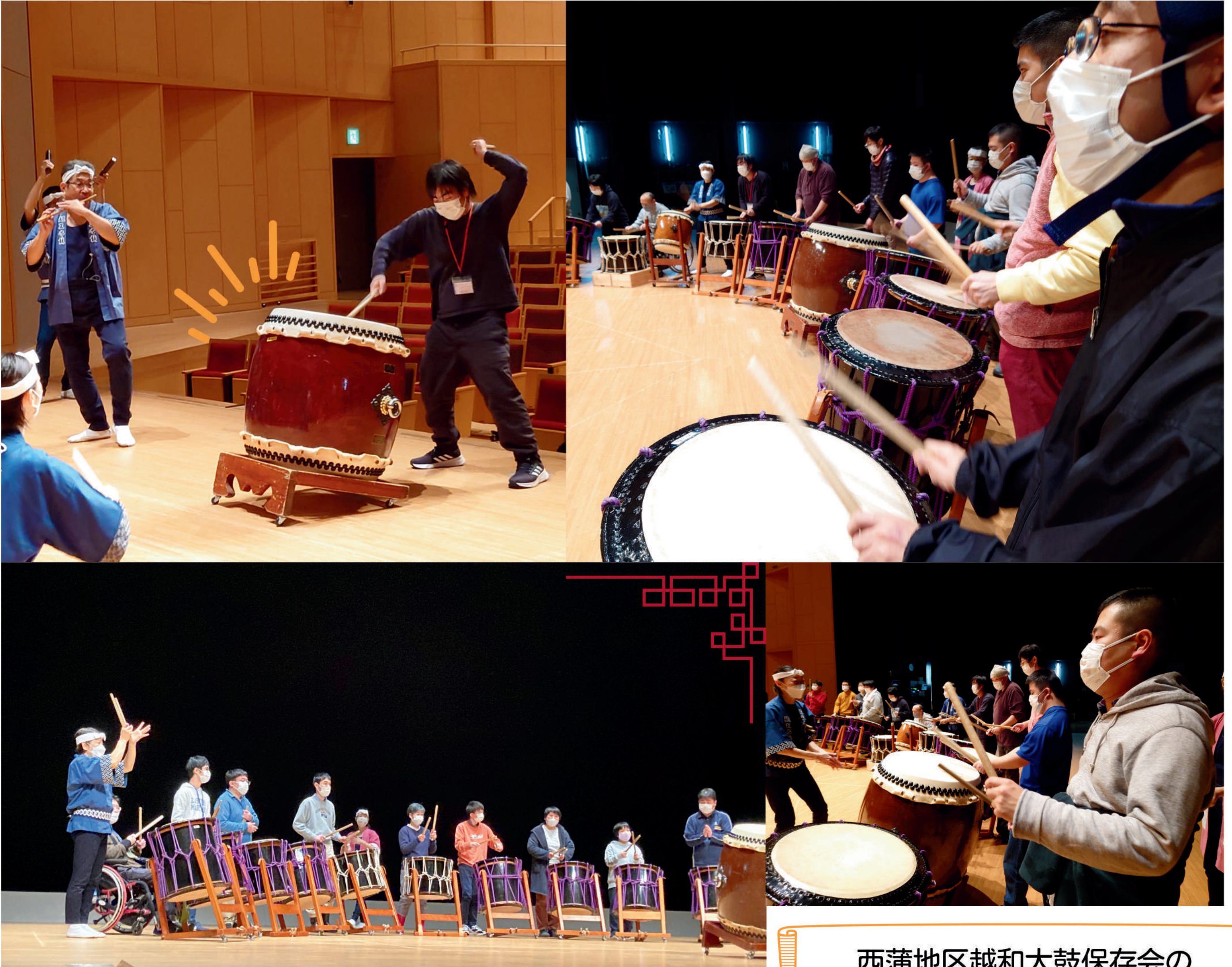
西蒲地区越和太鼓保存会の みなさんと息を合わせてドン！！