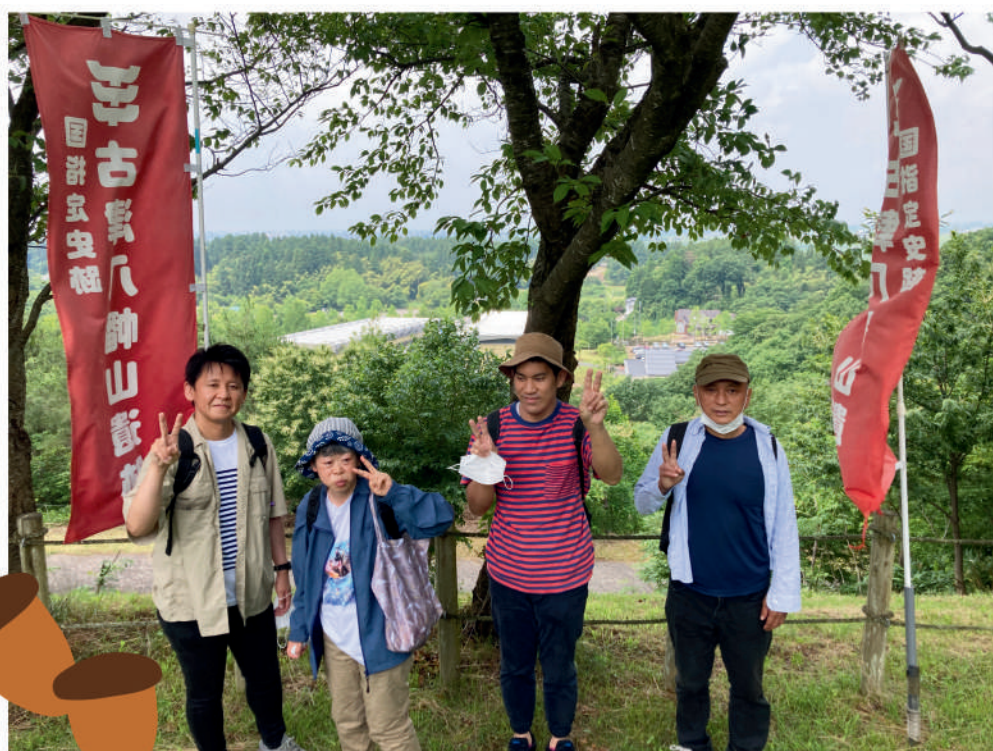
八幡山に登りました 風が気持ちいいですね