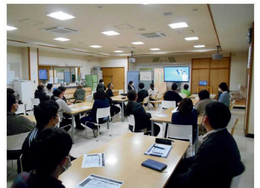
令和4年12月 産休・育休研修