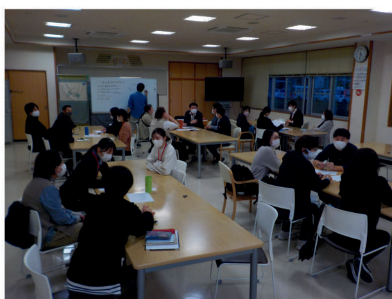
令和4年11月 清水基金伝達研修