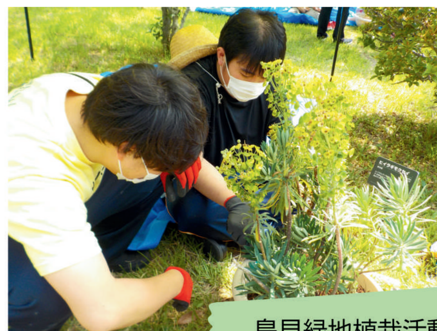
島見緑地植栽活動