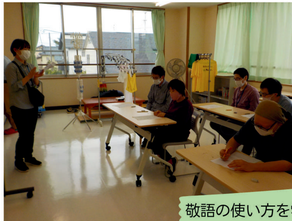
敬語の使い方を学ぶ