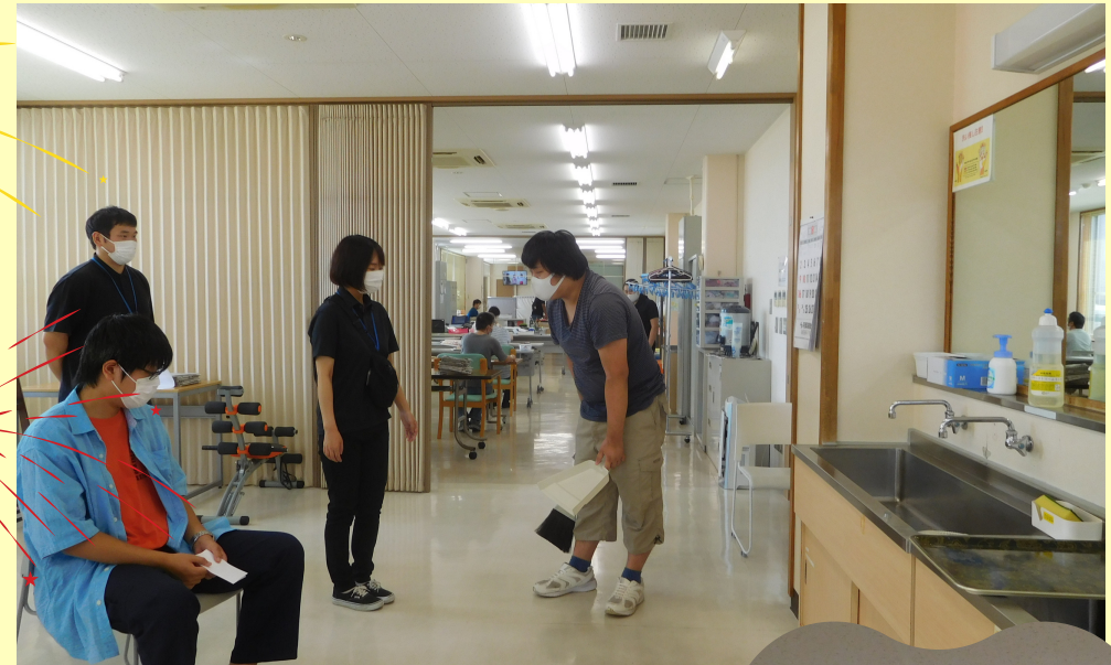
ひしもの家 夏祭り