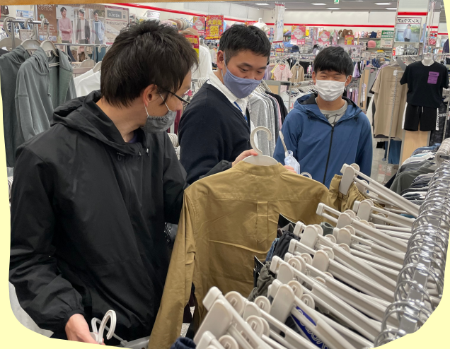
一緒に洋服を選びます