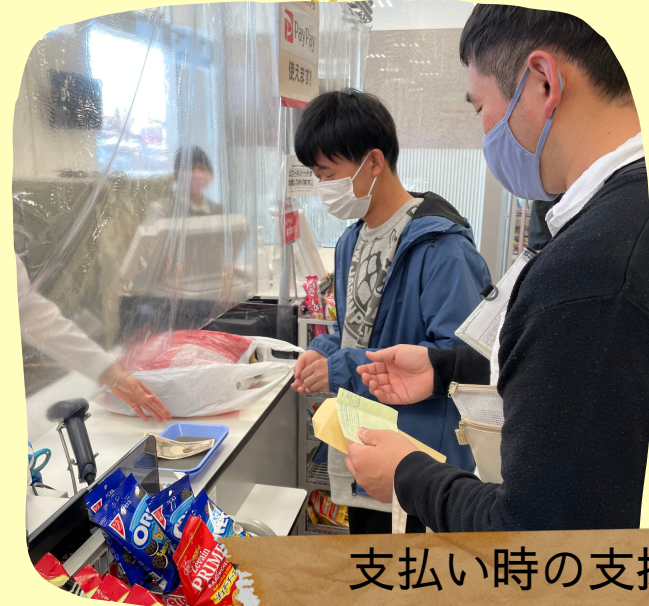
支払い時の支援を します