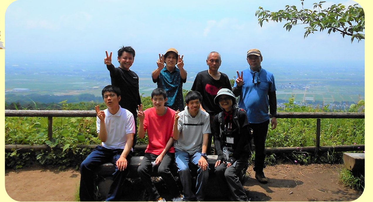
令和2年12月25日 クリスマス会