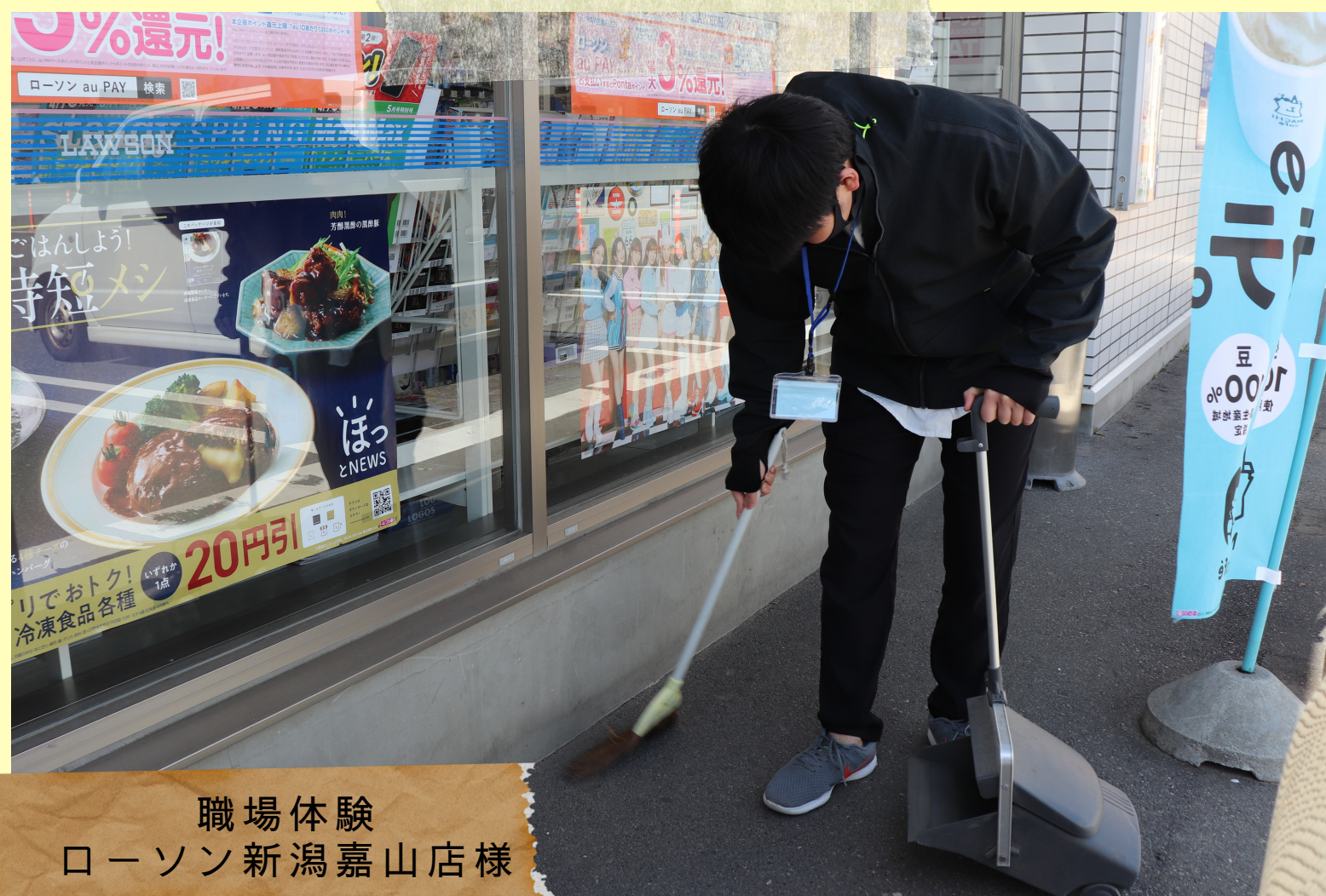
職場体験 ローソン新潟嘉山店様

『就労定着支援』 現在までに6人が利用し、安心し て企業就労を継続できるよう、 職員がフォローアップをしてい ます。