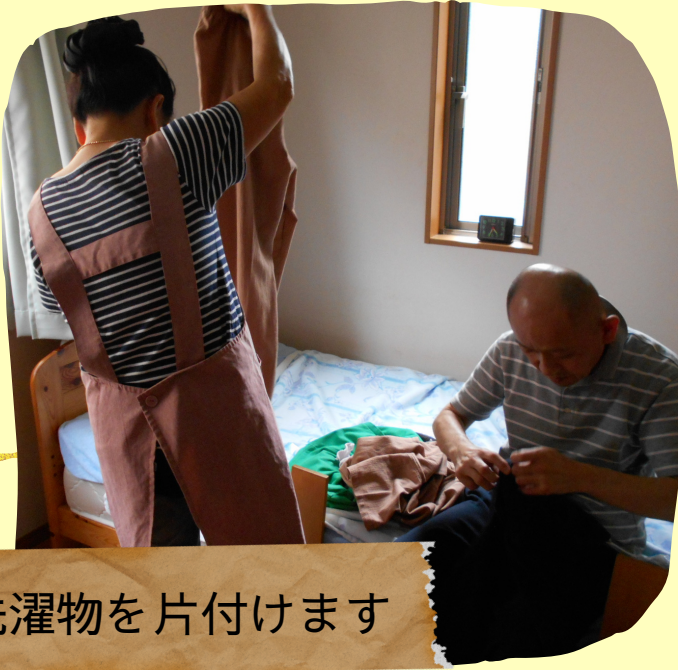
洗濯物を片付けます