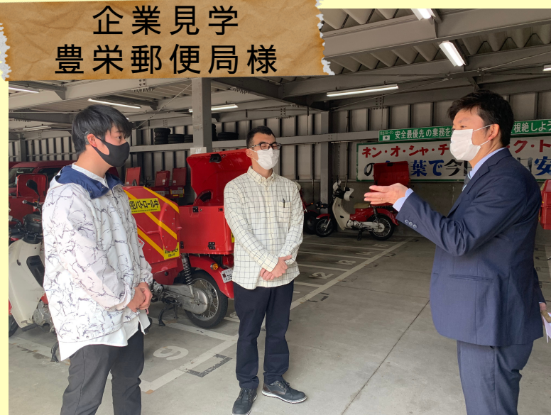
企業見学 豊栄郵便局様