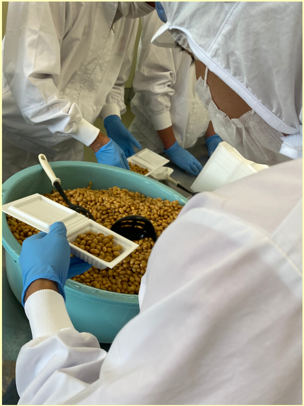
美味しい納豆 作っています

『就労継続支援B型』 平均工賃6,500円を目標に、 色々な作業に挑戦できるよう 支援を行っています。