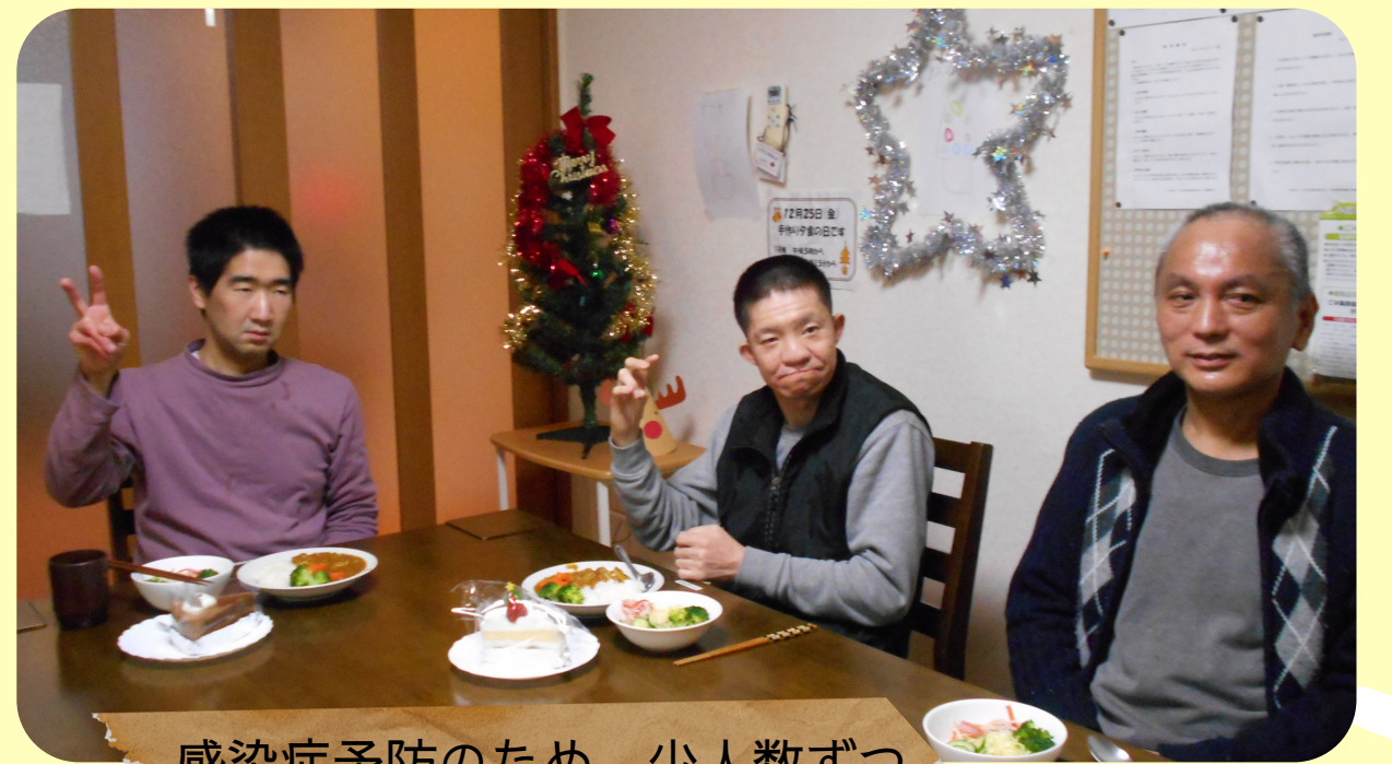
感染症予防のため、少人数ずつ わかれて開催しました