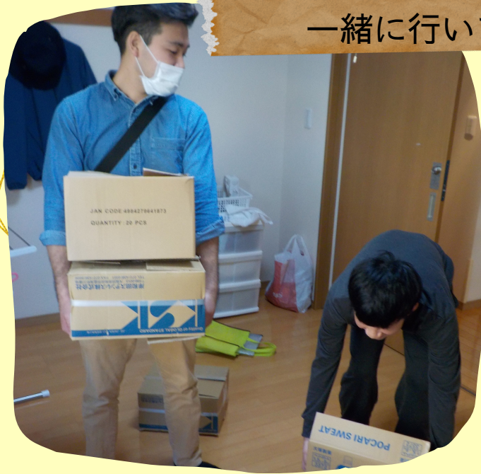
入居時の荷物整理を 一緒に行います