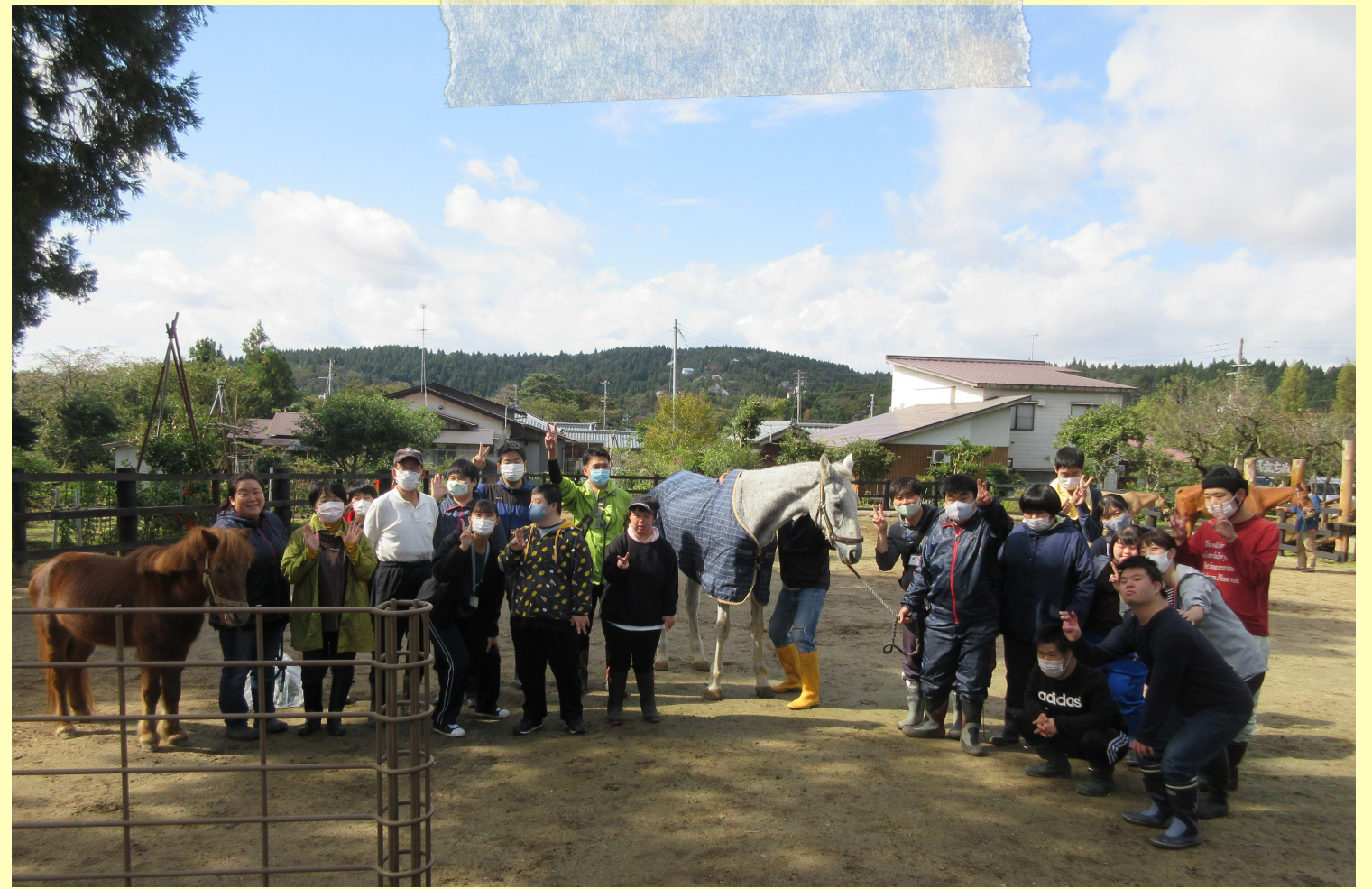
さつまいも・落花生の収穫体験

『生活介護』 表現活動（アート・音楽など） に力を入れ、自由に発信できる 機会を提供しています。 また、リフレッシュの機会として 運動支援を取り入れ、健康的 な生活が送れるように支援をし ていきます。