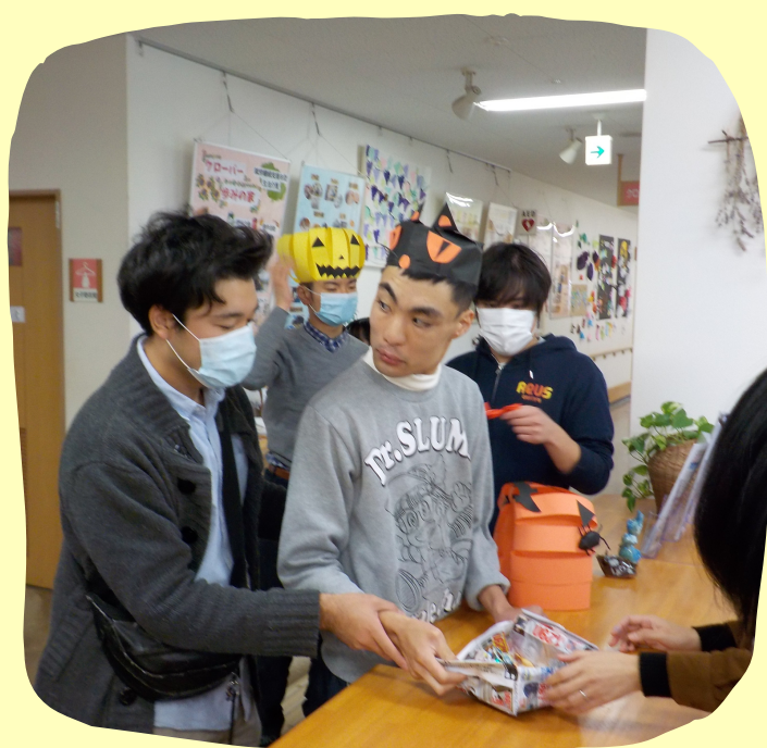
ハロウィンの様子